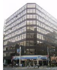
栄・宝第一ビル 外観図