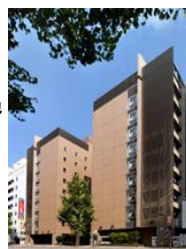
名古屋栄 ワシントンホテルプラザ 外観図